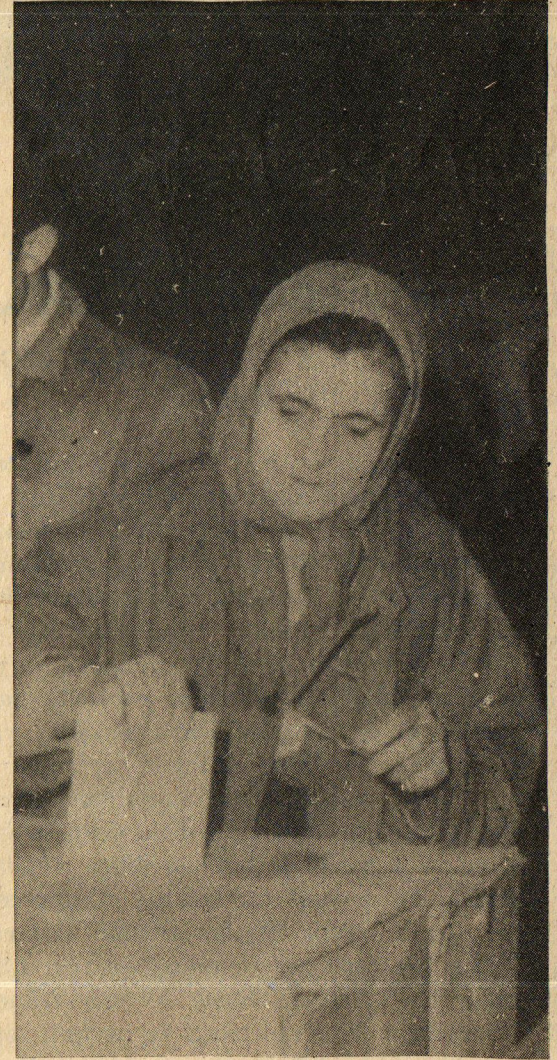
Hükümet programında işçilerin sendikalarını serbestçe seçme ve sendika seçiminin referandumla sağlanmasını gerçekleştirecek hükümler YOK !