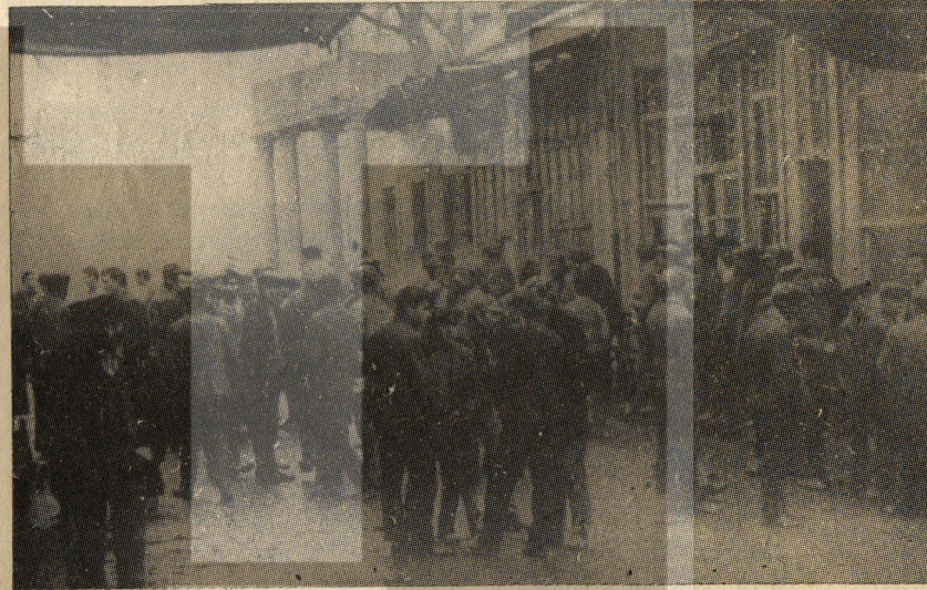
Hükümet programında İŞSİZLİK SİGORTASI YOK !