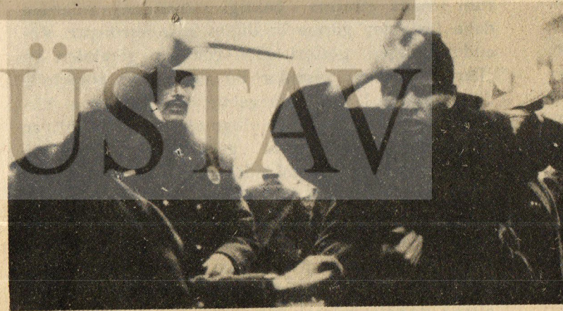
Hükümet programında işçi sınıfına karşı yürütülen baskı ve zorbalıkların önleneyeğini ve daha önce bu suçları işleyenlerin cezalandırılacağını belirten bir hüküm YOK !